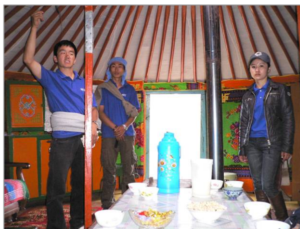
1 日目に訪問した遊牧民の大きなゲルの中 3 人は現地ガイド右から 2 人は学生