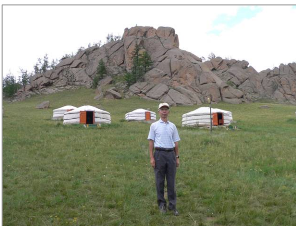
テレルジのハミルトゥリストキャンプ場 4 人用のゲルに友人と 2 人で宿泊 中は意外に広く快適に過ごせた

参加者 7 人の内訳は娘を含む親子 3 人と、一人で参加した若い女性と中年の女性 の 2 人と私たち 2 人で合計 7 人である。話を聞くと乗馬の経験者は私たち 2 人だけで、他は皆さん乗馬経験なしで乗馬ツアーに参加したという人達ばかりであった。現地ガイドは 3 人で、別に運転手付で 4 日間のガイドは配慮が至れり尽くせりで大満足であった。ただ、クラブではせいぜい 1 日 3 時間しか乗馬しないのに、1 日目が 4 時間、2 日目が 4 時間+3 時間、3 日目が 6 時間で相当ハードなツアーであった。ビギナーの人達も 1 日目が 4 時間、2 日目が 3 時間、3 日目が 6 時間で相当にきつかったと思う。