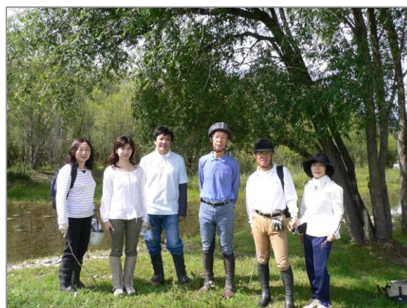
3 日目のツアー、今回同行の 6 人。1 人は市内見学に行き乗馬不参加

キャンプ地から、ランドクルーザーに乗って約 30 分、馬主の放牧地に向かう。奥テルルジと言っていたが、キャンプ地から約 15km 離れている。ここから馬主は毎日 10 頭の馬を引いて私たちのキャンプ地まで来て、夕方に連れ帰っていたという。大変な労働であると思った。私たちが乗る馬は毎日同じ馬なのだが、同じ馬を放牧地から集めるのに時間がかかったので、急遽コース変更になって馬主の放牧地出発のコースになった。これが返