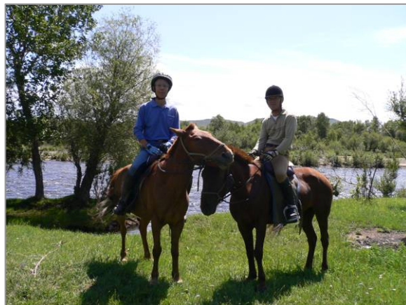
2 日目のツアー、冬営地の草原で駈歩をした後、ツール川のほとりで休憩

1 日目のトレッキングで我々の技量を見てもらい、2 日目はビギナー組と経験者組で分けて別メニューで実施してくれた。私たちは、キャンプ地の南側に聳える高い山の向こう側に行くという。私達 2 人にガイド 1 人と遊牧民の馬主 1 人の 2 人がついて 2 時間かけて山越えをして遊牧民の冬営地であるという盆地状の大草原に出て、ここで駈歩を存分にさせて貰った。私の乗った馬はモンゴルのナーダムという祭典に行われる競馬に出たという馬で足が速い上に一番前に出たがる。駈足では先導の馬主の馬を