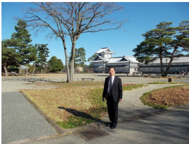
金沢城公園 二の丸広場にて昼休みの散歩中。 後ろの建物は、五十間長屋ですが、屋根が白いのは、鉛瓦で葺かれているためです。

北陸、金沢は、冬が近づく季節となりますと、天気の良い日が多くなります。そのため、春や秋を中心に、しかし夏はさすがに汗だくとなりますので頻度はめっきり少なくなります。健康のため、できるだけ昼休みに散歩に出かけるようにしています。職場から程近い金沢城公園の中や兼六園周辺を30分程度散歩しております。雨などが降りますと外には出られないため、市役所庁舎と地下で連絡されている金