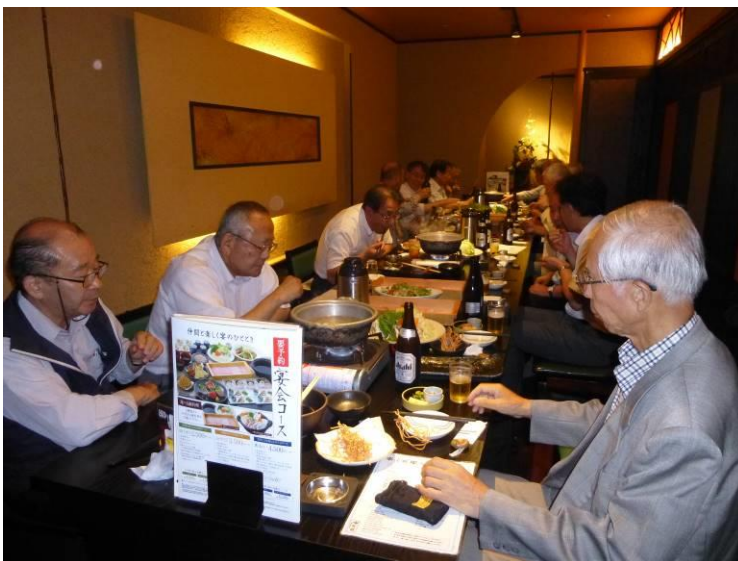
交流会場の参加者の皆さん